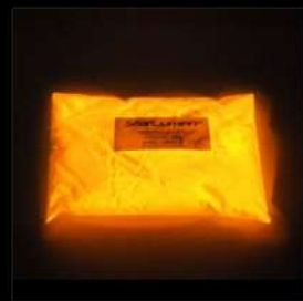
Orange Luminance faible Solvant uniquement