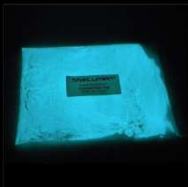
Turquoise Luminance moyenne Solvant et Hydro Toute granulométries