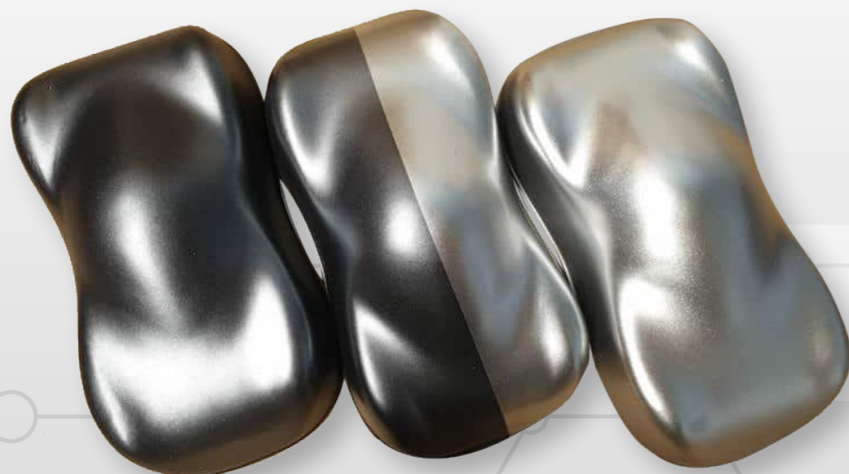
Candy Grundierungen BC1 et BC2