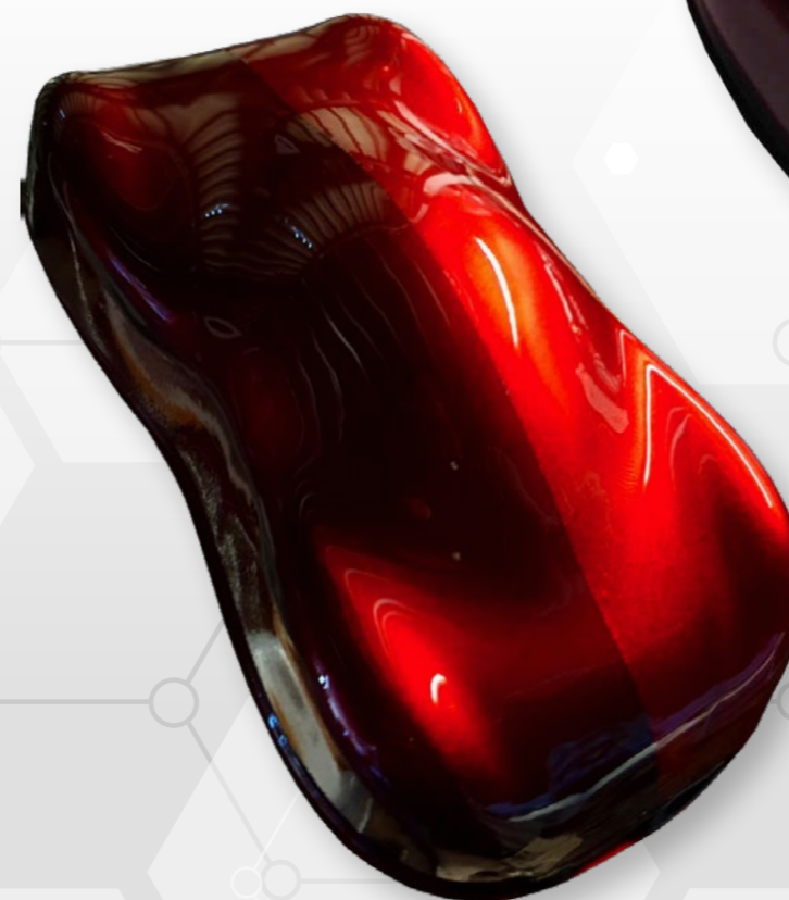
Zweifarbige Ergebnis von CANDY