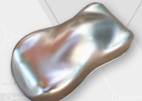
BC60 Micro aluminium