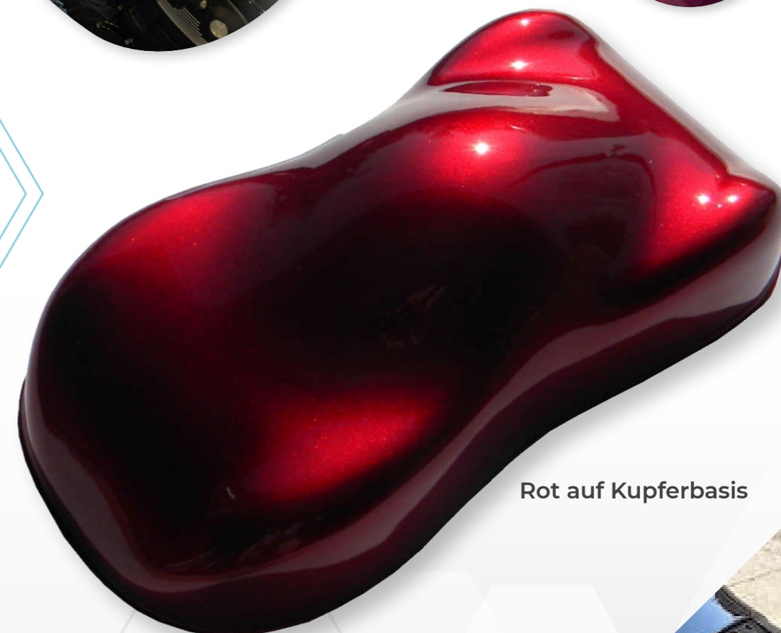
Rot auf Kupferbasis