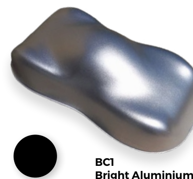
BC1 Bright Aluminium