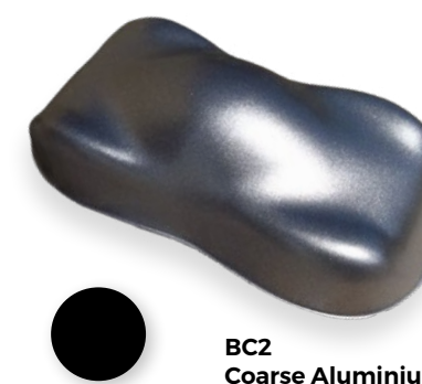
BC2 Coarse Aluminium