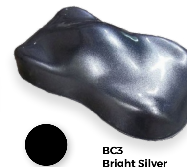
BC3 Bright Silver