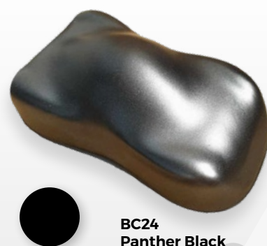
BC24 Panther Black