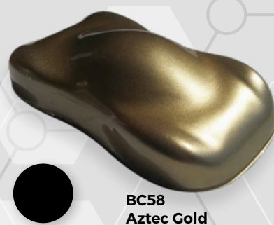
BC58 Aztec Gold