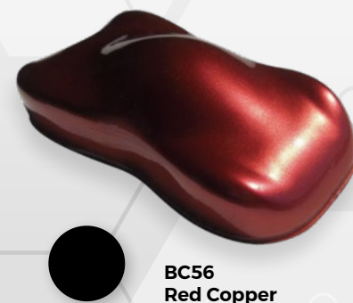
BC56 Red Copper