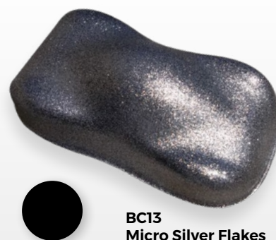
BC13 Micro Silver Flakes