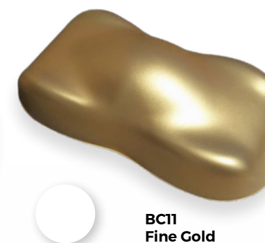
BC11 Fine Gold