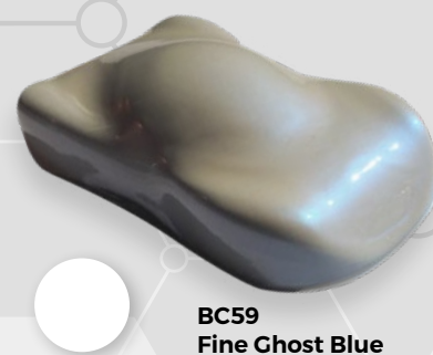
BC59 Fine Ghost Blue