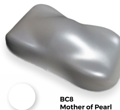
BC8 Mother of Pearl