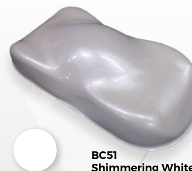
BC51 Shimmering White