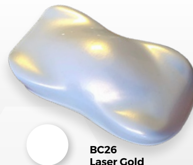
BC26 Laser Gold