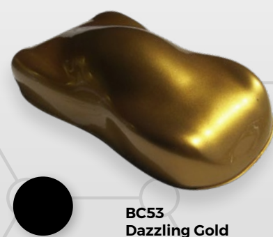
BC53 Dazzling Gold