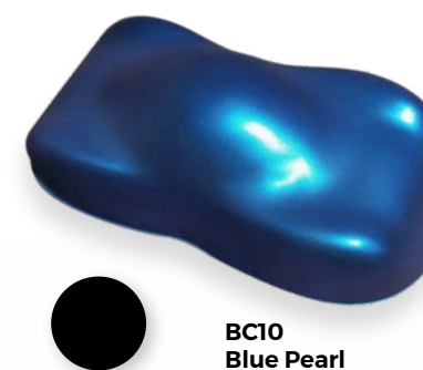
BC10 Blue Pearl