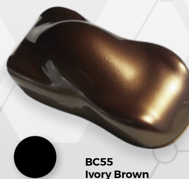
BC55 Ivory Brown