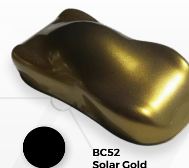
BC52 Solar Gold