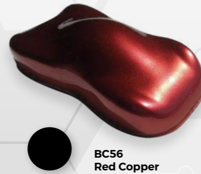
BC56 Red Copper