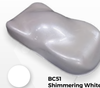
BC51 Shimmering White