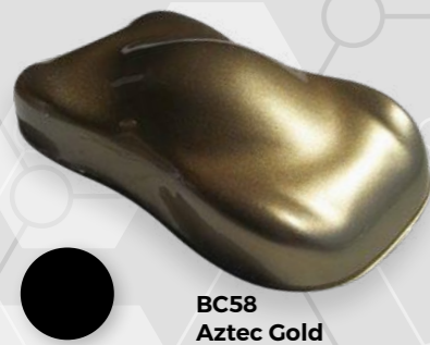
BC58 Aztec Gold