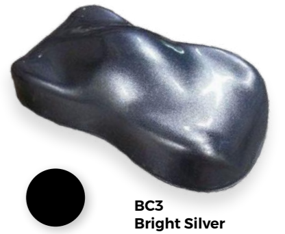
BC3 Bright Silver