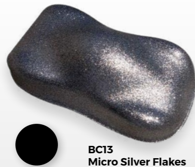
BC13 Micro Silver Flakes