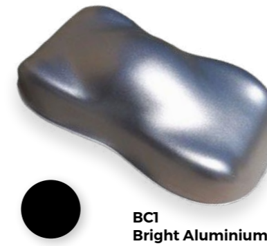
BC1 Bright Aluminium