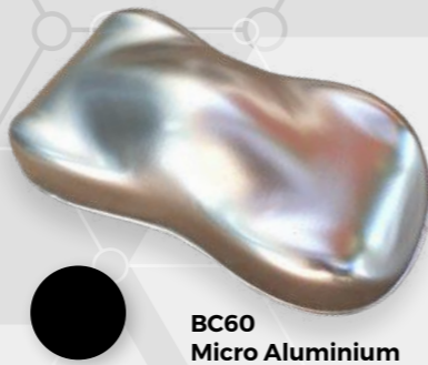
BC60 Micro Aluminium