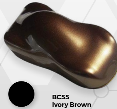
BC55 Ivory Brown