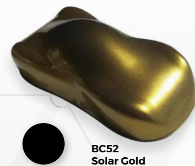
BC52 Solar Gold