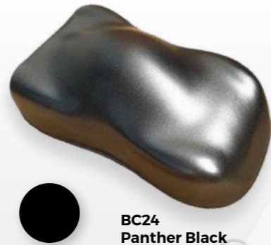
BC24 Panther Black