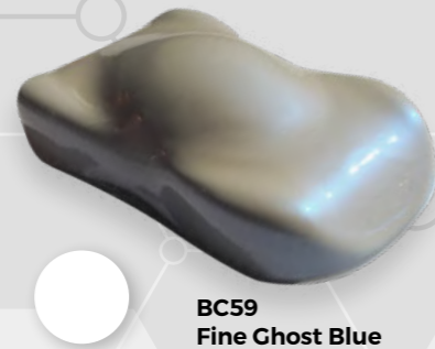
BC59 Fine Ghost Blue