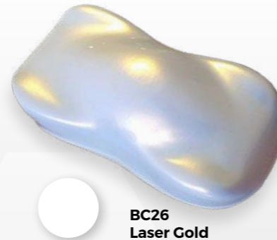
BC26 Laser Gold