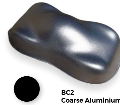
BC2 Coarse Aluminium