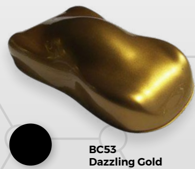
BC53 Dazzling Gold