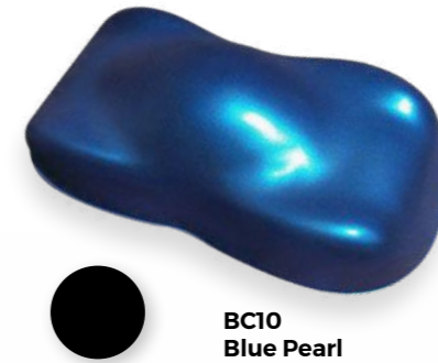
BC10 Blue Pearl