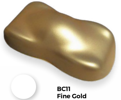
BC11 Fine Gold