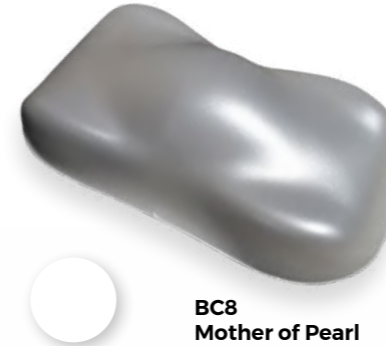
BC8 Mother of Pearl