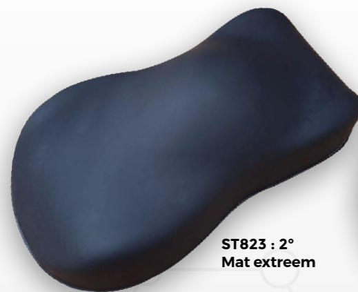
ST823 : 2° Mat extreem