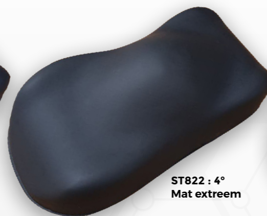
ST822 : 4° Mat extreem