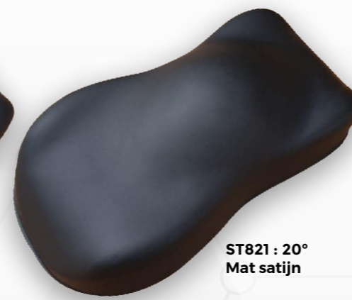
ST821 : 20° Mat satijn