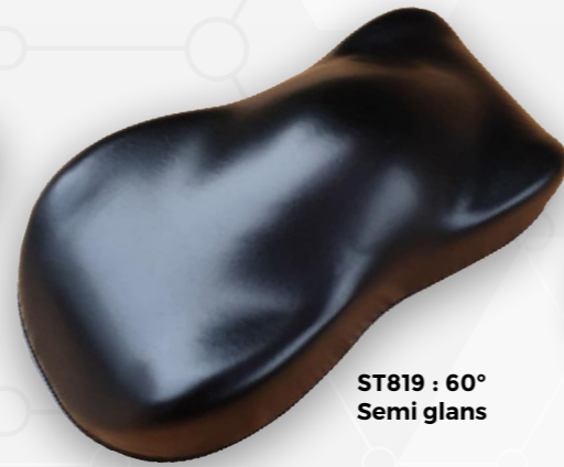
ST819 : 60° Semi glans