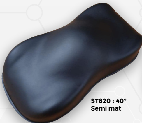
ST820 : 40° Semi mat