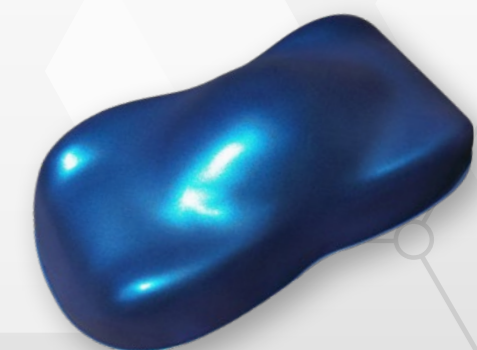
BC10 Fine blue pearl