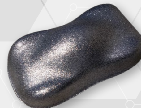
BC13 Micro flakes