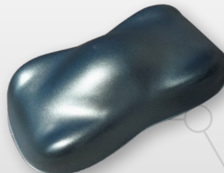
BC6 Jade diamond