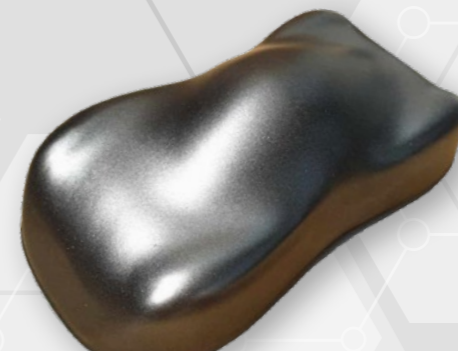
BC24 Panther black