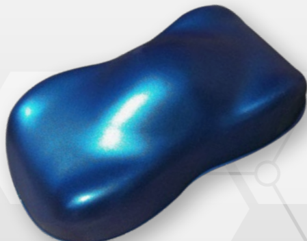
BC7 Blue diamond