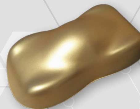
BC11 Fine gold