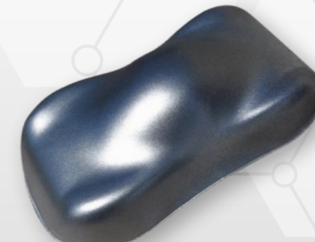
BC9 Silver pearl