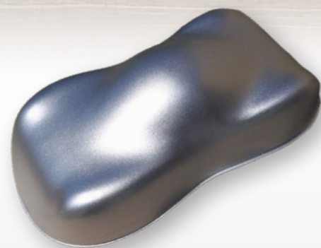
BC1 Bright aluminium