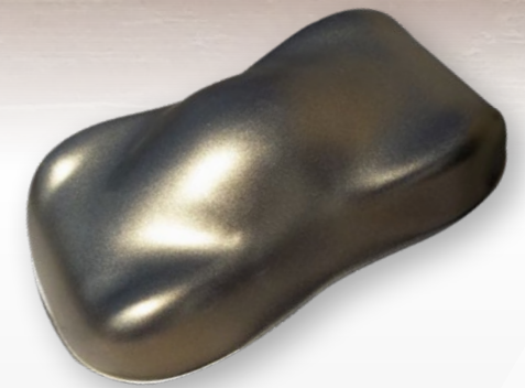
BC5 Gold diamond