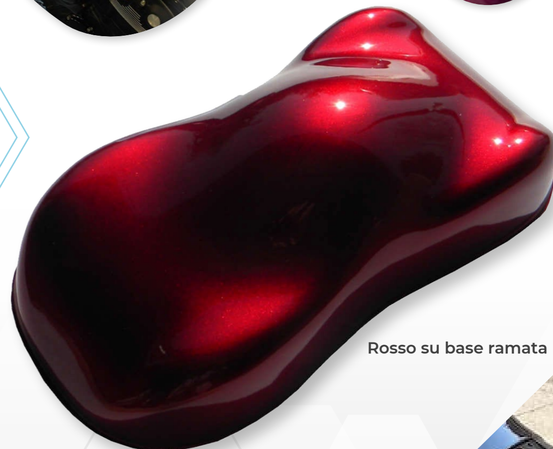
Rosso su base ramata