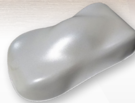
BC4 White diamond