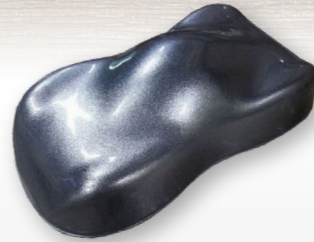
BC3 Silver diamond