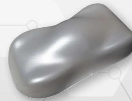
BC8 Mother of pearl