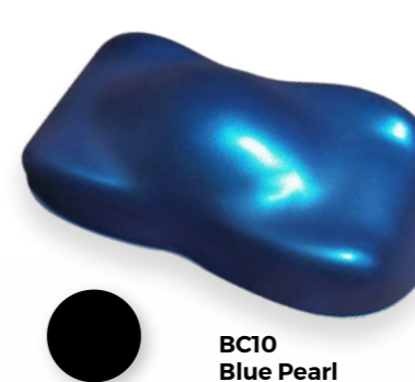
BC10 Blue Pearl