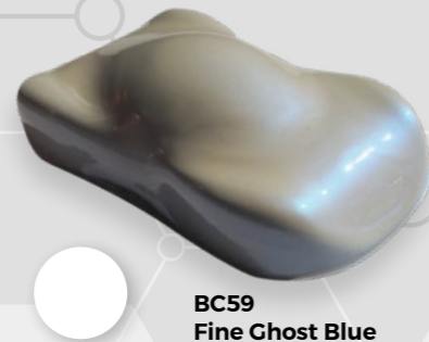
BC59 Fine Ghost Blue