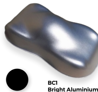
BC1 Bright Aluminium