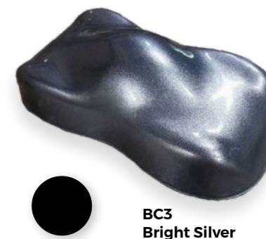
BC3 Bright Silver