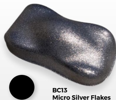
BC13 Micro Silver Flakes