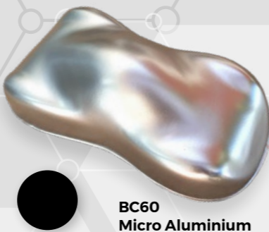
BC60 Micro Aluminium