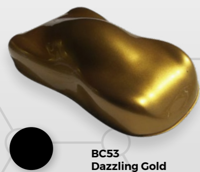
BC53 Dazzling Gold