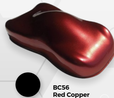
BC56 Red Copper