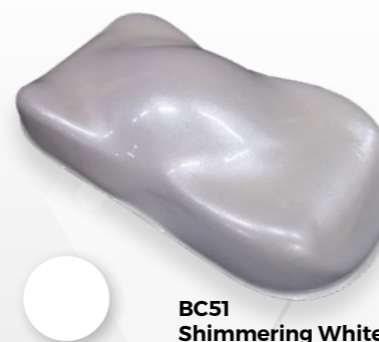
BC51 Shimmering White