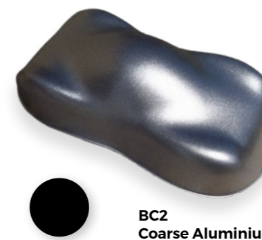
BC2 Coarse Aluminium