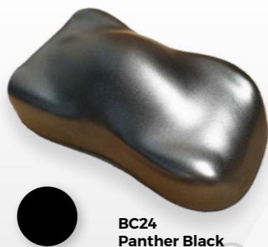
BC24 Panther Black