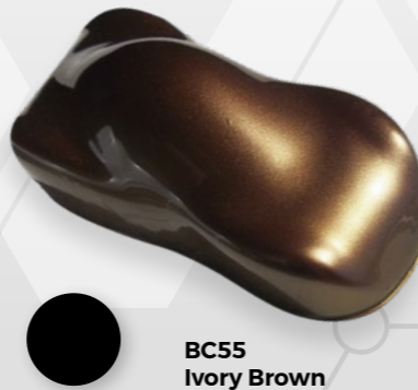
BC55 Ivory Brown